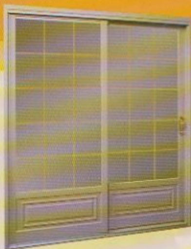
▲ Porte patio jardin sable avec carrelage laiton standard et poignée mortaise 4 points laiton fini garantie à vie