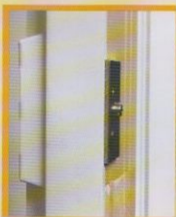
Gâche fait en acier inoxydable boulonnée sur une plaque de sécurité en acier sécurise la gâche au cadre de bois traité.