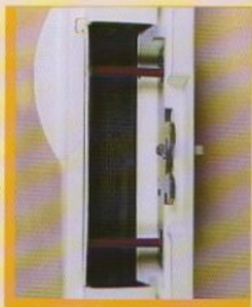
Boulons et double crochets fait en acier inoxydable prévient l'entrée par effraction.