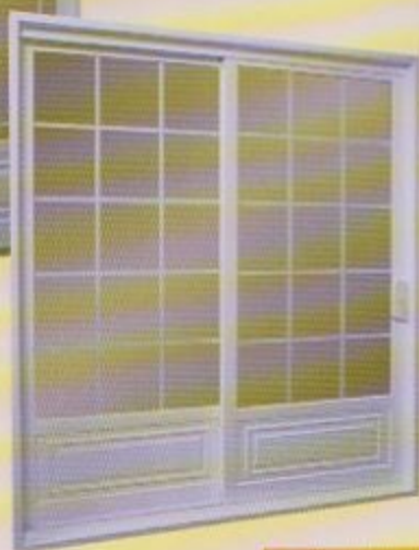
◀ Porte patio jardin avec carrelage georgien contour