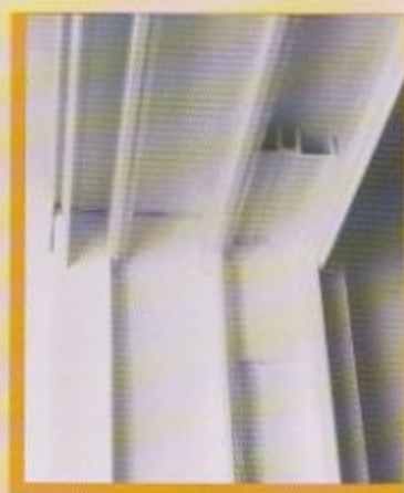
Blocs anti-levage empêchent le soulèvement des panneaux de l'extérieur.

Certifié NIVEAU 40 en laboratoire, le plus haut degré de résistance contre l'entrée par effraction pour une porte patio résidentielle en AMÉRIQUE DU NORD.