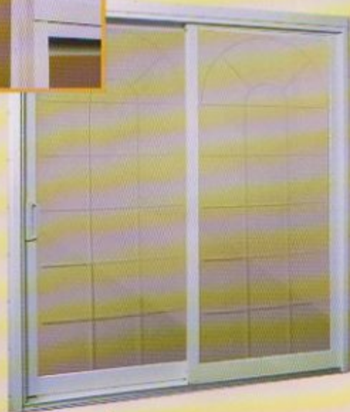
▲ Porte patio avec verre rainuré à tête demi-lune et lame de clouage